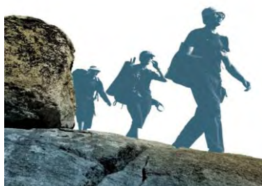
Geo & Geologia