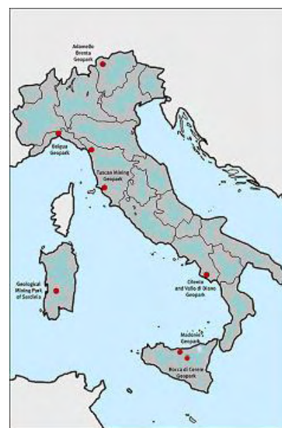
I Geoparchi in Italia