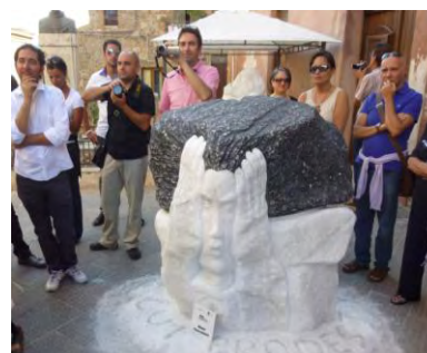
Geo & Arte