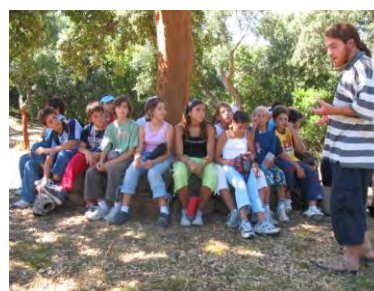
Geo & Educazione