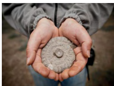
Geo & Cultura

(European & Global Geopark, con il supporto dell'UNESCO)