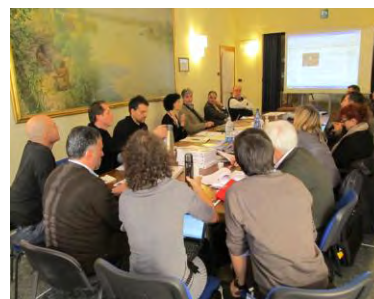
Geo & EGN/GGN

"Trovare insieme è un inizio, restare insieme un progresso...lavorare insieme un successo" (Henry Ford)